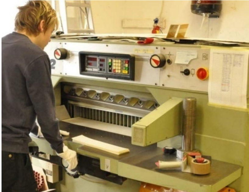
Pehmeiden eristeiden leikkausta